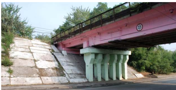
Рис. 2. Загальний вид укріплення конусів насипу