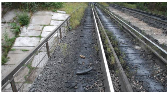
Рис. 3. Загальний вид мостового полотна

Проект виконувався за договором від 17 жовтня 2013 року, на основі завдання на проектування, матеріалів інженерно-геодезичних, інженерно-геологічних вишукувань і натурних обстежень, які були виконані спеціалістами Дніпропетровського національного університету залізничного транспорту імені академіка В. Лазаряна у жовтні 2013 р.